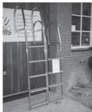
RVS 316 zwemtrap leverbaar in 4 of 5 treden