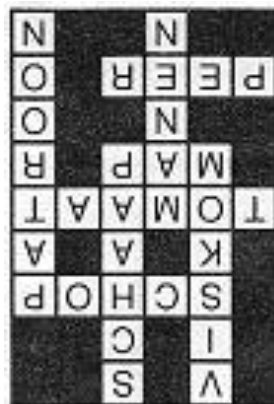
Oplissing van pagina 10